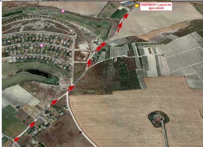
(Vista de pájaro de toda la cuesta)

Bajamos toda la cuesta y llegamos al punto de asistencia 1 y 2 FASE VERDE y Asistencia 1 y 2 FASE AZUL