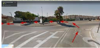
rotonda del BETIS

Seguimos por el callejón de Guía y antes de entrar a la playa giramos a la derecha. OJO!! es un punto conflictivo pues tiene mucho tráfico y es muy estrecho.